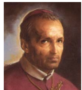
SAN ALPHONSUS LIGUORI

amigo que puede hacer todo por nosotros, un amigo que nos ama sin límites. Aquí en el Santísimo Sacramento podemos hablarle directamente desde el corazón. Podemos abrir nuestras almas a Él, decirle lo que necesitamos, rogarle por poderosas gracias. Somos perfectamente libres de acercarnos al Rey del universo con plena confianza y sin miedo. Jesús nos dice que donde esté nuestro tesoro allí estará nuestro corazón. Por lo tanto, los santos, que no aprecian ni aman ningún otro tesoro aparte de Jesucristo, centran sus corazones y todo su amor en el Santísimo Sacramento.