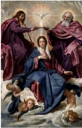
CORONACIÓN DE LA VIRGEN POR DIEGO VELÁZQUEZ

"SI REALMENTE AMAMOS AL DIOS BUENO, DEBEMOS HACER QUE SEA NUESTRO GOZO Y FELICIDAD VENIR Y PASAR UNOS MOMENTOS PARA ADORARLO, Y PEDIRLE LA GRACIA DEL PERDÓN, Y DEBEMOS CONSIDERAR ESOS MOMENTOS COMO LOS MÁS FELICES DE NUESTRAS VIDAS. "