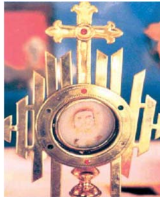
CUSTODIA CON LA HOSTIA MILAGROSA EN CHIRATTAKONAM, INDIA

Si nuestro Señor está hablándonos a través de este signo, ciertamente reclama una respuesta nuestra ". La custodia que contiene la Hostia milagrosa se mantiene hasta el día de hoy en la iglesia. Este milagro eucarístico fue verificado en 5 de mayo de 2001 en Trivandrum, India.