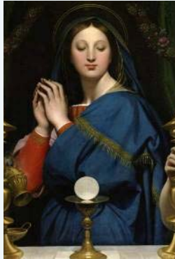
MADONNA DEL ANFITRION POR JEAN AUGUSTE DOMINIQUE INGRES

Mysterium fidei! Si la Eucaristía es un misterio de la fe que tanto trasciende nuestro entendimiento como exige un abandono total a la palabra de Dios, entonces no puede haber nadie como María que actúe como nuestro apoyo y guía en la adquisición de esta disposición. Al repetir lo que