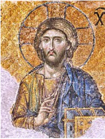
CRISTO PANTOCRATOR HAGIA SOFÍA ISTANBUL, TURQUÍA

"NO PECAMOS CUANDO ADORAMOS A CRISTO EN LA EUCARISTÍA. NOSOTROS PECAMOS CUANDO NO ADORAMOS A CRISTO EN LA EUCARISTÍA".